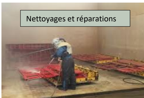
Nettoyages et réparations